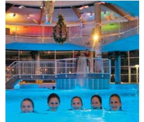
Stappegoor – Tilburg (NL)

Ook het Spurd-Leegwaterbad stapte over naar de LED-verlichting van WaterVision. Bij de bouw van het nieuwe zwembad in 2005 zijn de oude 300 Watt Bega-lampen vervan-