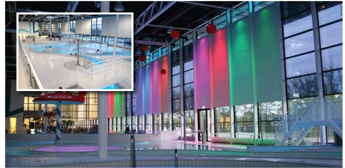
Leeghwaterbad – Purmerend (NL)